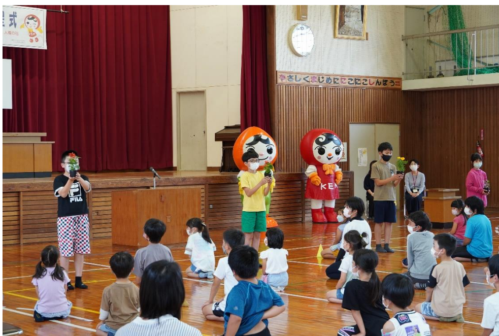
「人権の花」贈呈式（令和4年6月9日）